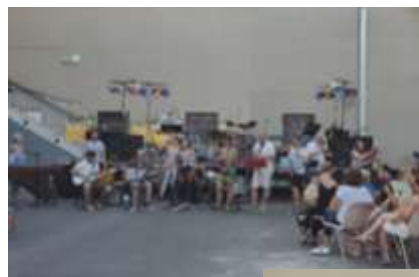
Fête de la musique : concert, exposition