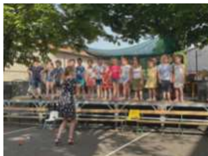
Fête de l'école