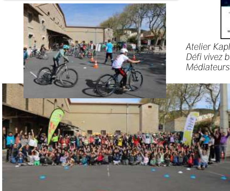
Atelier Kapla, Défi vivez bougez, Médiateurs scolaires.