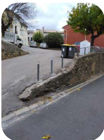
Potelets jeu de ballon