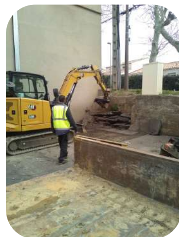
Sanitaires halle aux sports