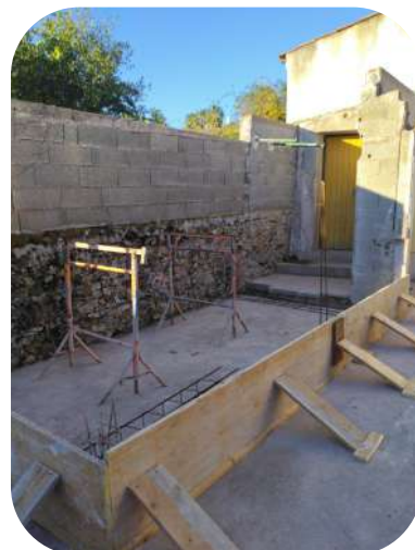
Annexe salle des mariages

Le coût estimatif des travaux est de 69 525 € . La commune a obtenu des subventions de 20 200 € de la part de l'État au titre de la DETR, et 5 000 € de la part de la Communauté de Communes Salagou Cœur d'Hérault.