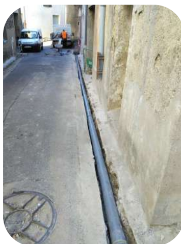
Pluvial Rue P.M. Curie