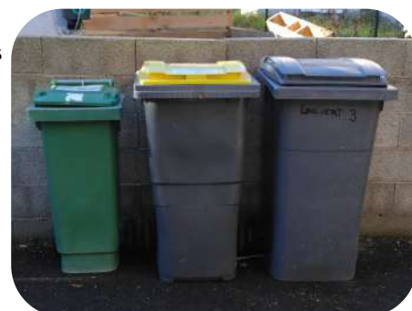
Points d'apport volontaire et bacs individuels